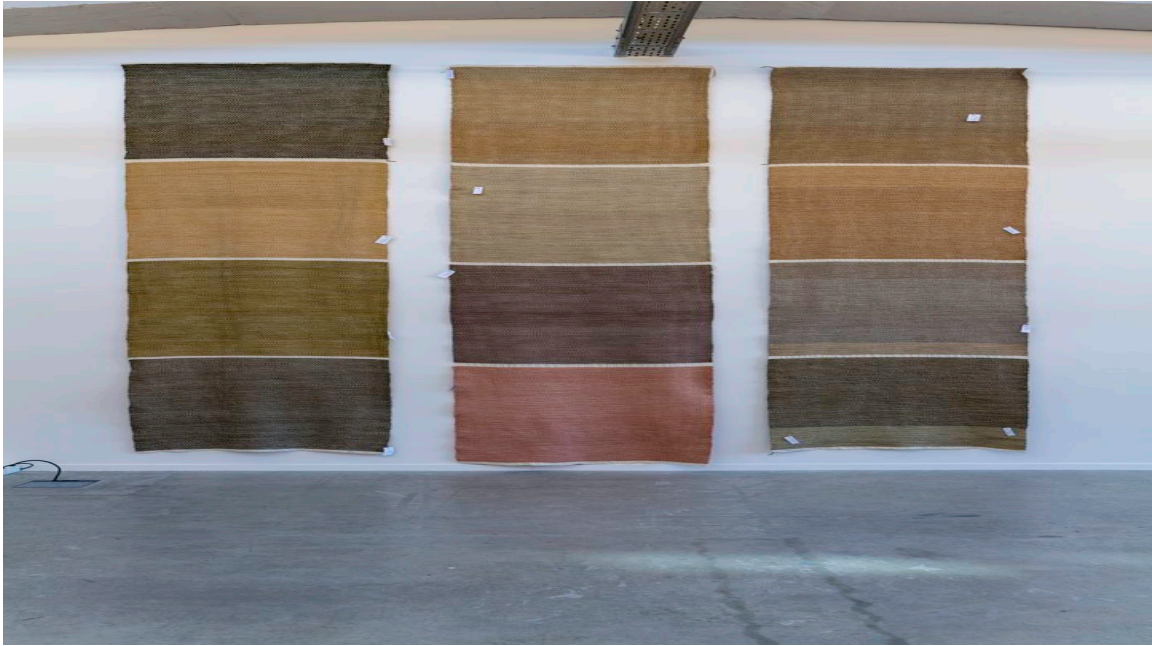
"Pantone Alsace: Reading the Landscape", des carreaux de tissus colorés avec des teintures à base de bogues de marronnier, de feuilles de vigne ou racines de garance cueillis en Alsace. (Jean-Jacques Delattre)